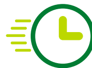
Rapidez en la Atención y Gestión