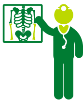
Diagnóstico por imagen