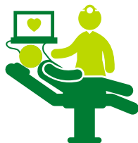
Otras áreas de diagnósticos