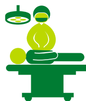
Unidad quirúrgica y uci