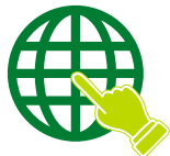
Plataforma de Gestión Sanitaria