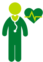
Tratamiento médico de calidad